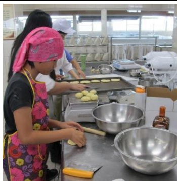
桿麵皮入烤箱烤囉