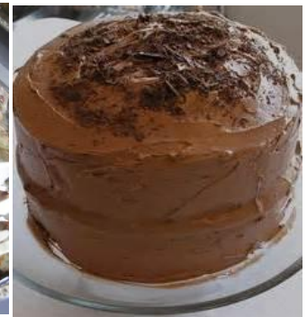
洋蔥火腿哈斯、休格拉巧克力蛋糕