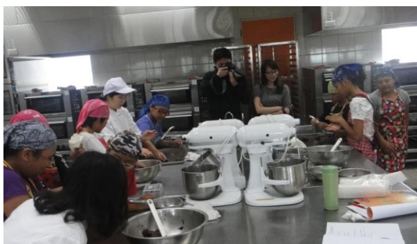
家樂福基金會承辦人員視察上課狀況