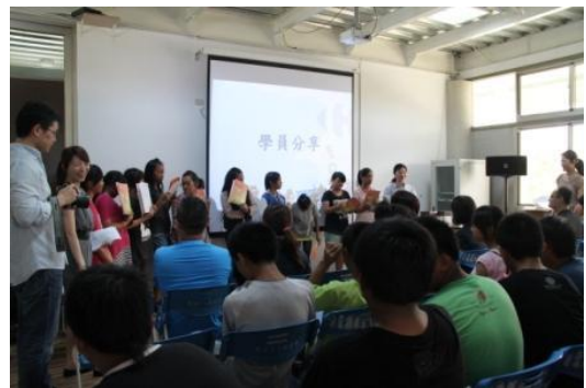
學員上課的心得分享