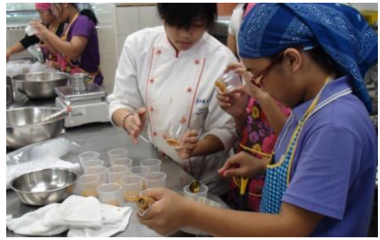
助教協助幫忙與教學