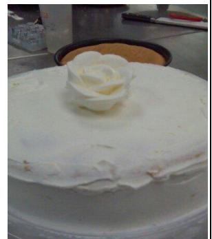
香草戚風、蛋糕裝飾