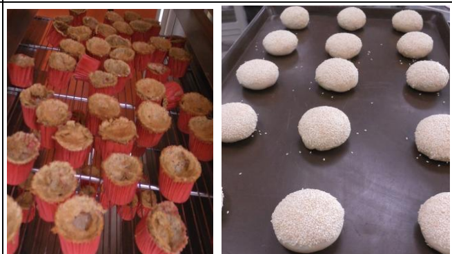
伯爵奶油蛋糕、胡椒餅