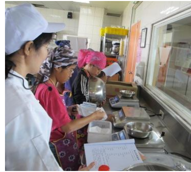
老師鄭督促學生千萬不要秤錯喔!!