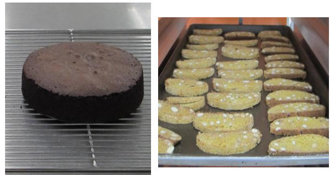
法式輕巧克力蛋糕、義式核果脆餅