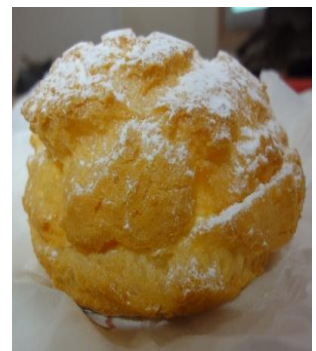
美式布郎尼蛋糕、日式泡芙