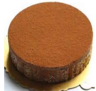
南瓜子瓦片、義式巧克力慕斯