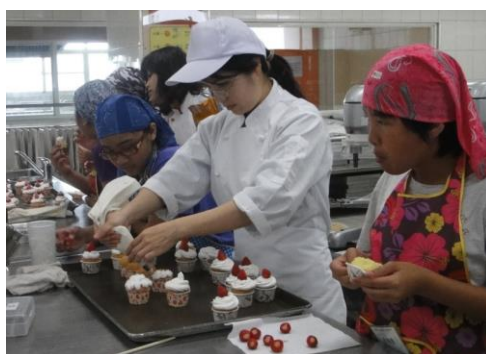
老師與學員們的互動狀況