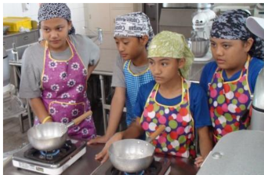
聽著老師的叮嚀，千萬不能煮焦了