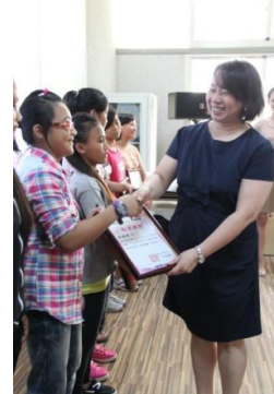
學員們快樂的領獎唷!