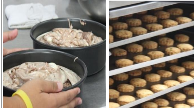
大理石戚風蛋糕、果香高鈣乳酪餅