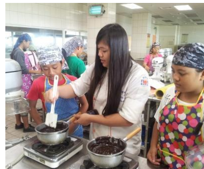
協助幫忙煮巧克力漿