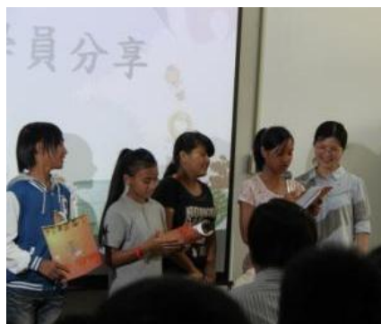
惠蘭老師感動的眼眶都紅了呢!