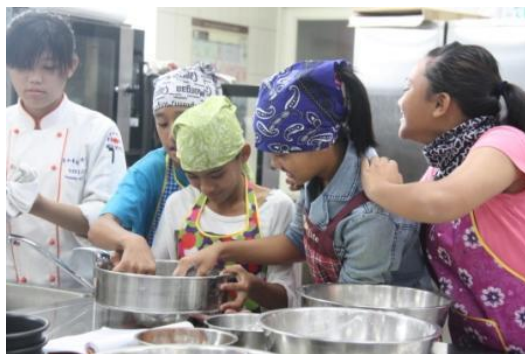
輕鬆學習，快樂成長