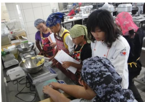
助教協助學員上課情形