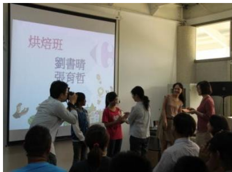
惠蘭老師班發全勤獎