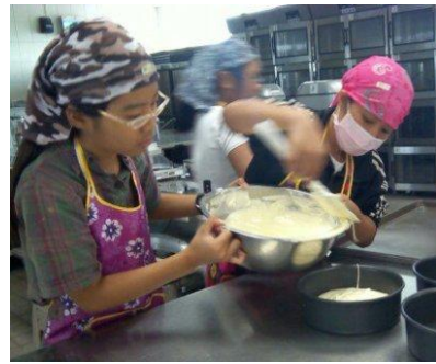
蛋糕體麵糊加工成型