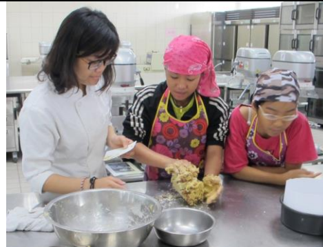
使勁的揉麵糰味道才會均勻唷!