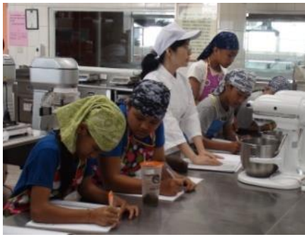
操作前的講解與示範