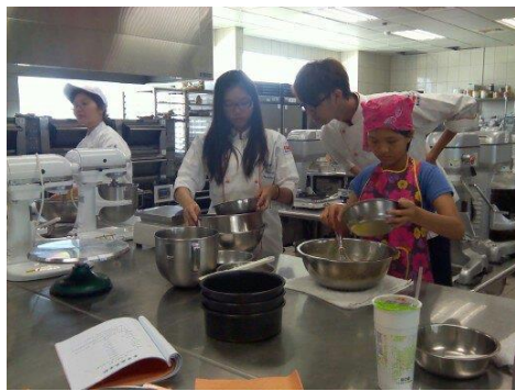
認真協助學員們的助教