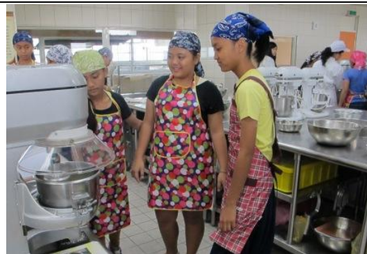
攪拌鋼的使用情形