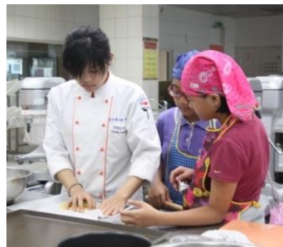
溫柔的助教協助技術指導