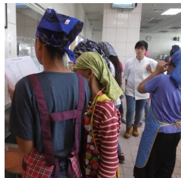
協助幫忙秤材料的助教