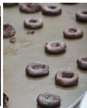
水果杯子蛋糕、巧克力丹麥奶酥