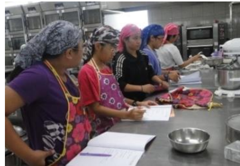
學員們的認真邊聽邊看