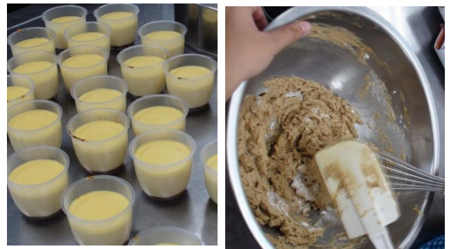
法式烤布丁、黑糖奶香薄餅