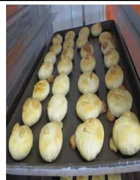
糖漬桔皮蛋糕捲、楓糖奶油小酥餅