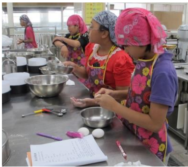
學員認真上課之情形