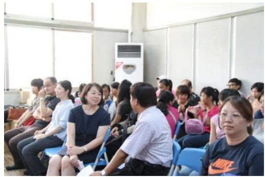
家樂福基金會長官及老師、學員們