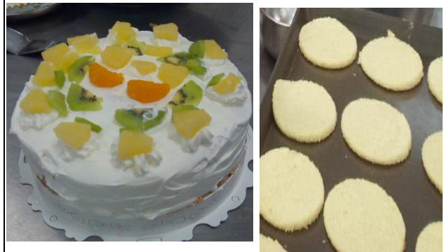
波士頓派、海苔薄片