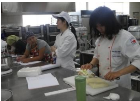
操作前的講解與示範