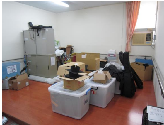
原資中心辦公室未更新前