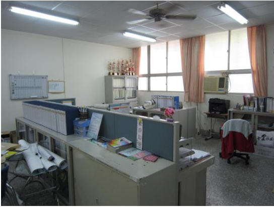
原資中心辦公室未更新前