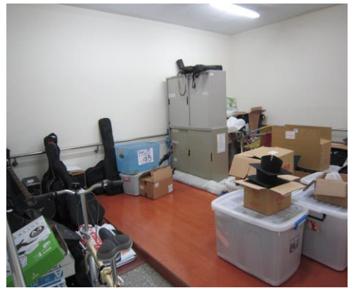
原資中心辦公室未更新前