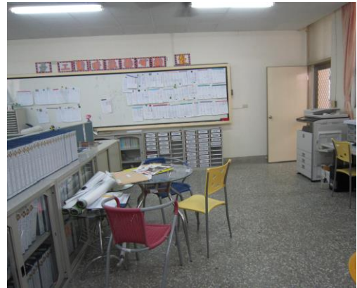
原資中心辦公室未更新前