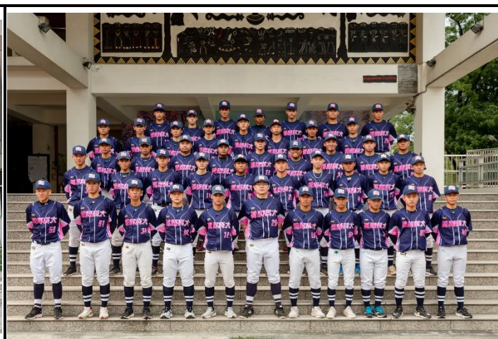
美和科大棒球隊全隊大合照