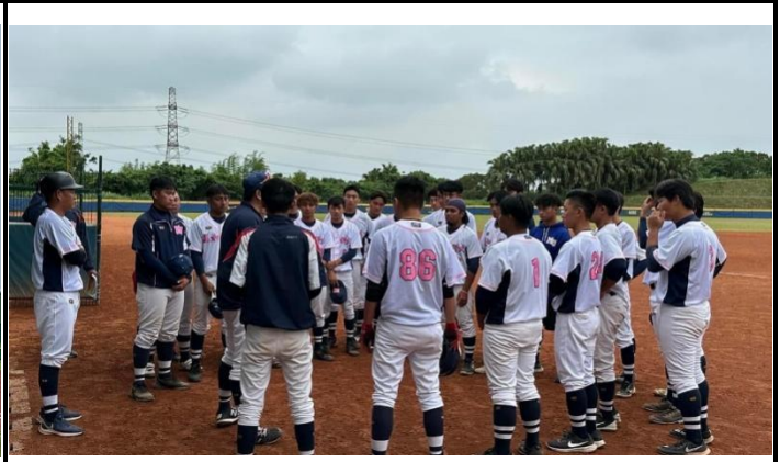
台北參加 2023 春季棒球聯賽