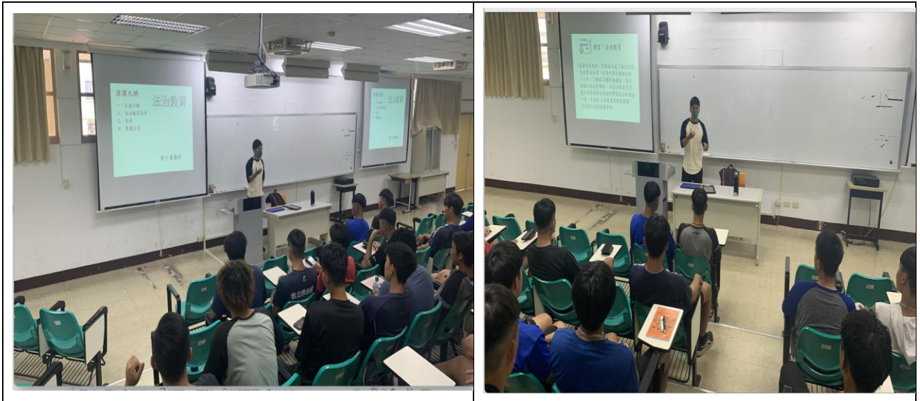
法治教育課程照片