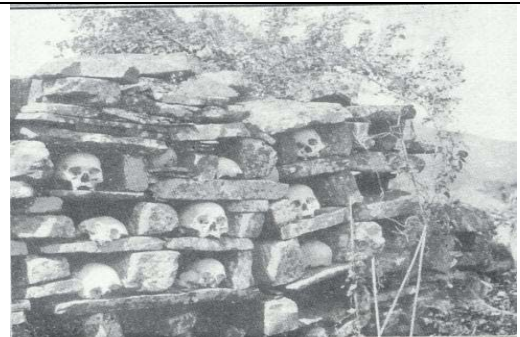
相片 8：敵首架