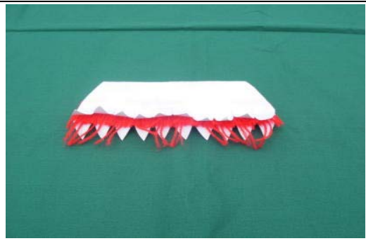
相片 2：白紙所剪出的額飾