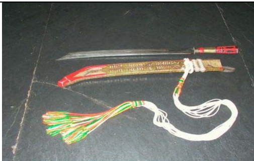
相片 5：禮儀佩刀 (Ljabu)