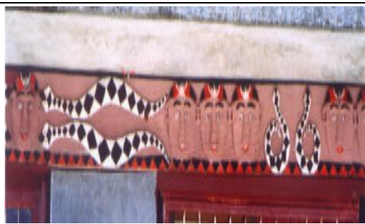
相片 6：吉露大頭目家的簷衍