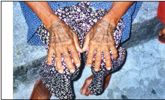
相片 1：西魯凱族的女性紋手