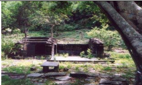
相片 7：Dadolu 大頭目家的前庭與榕樹