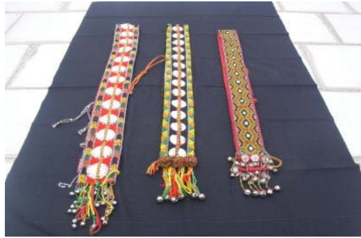
相片 4：男女掛帶 (Daraljaed)