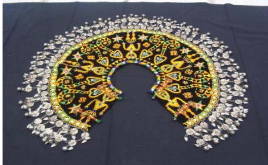
相片 3：女披肩 (Litukutuku)