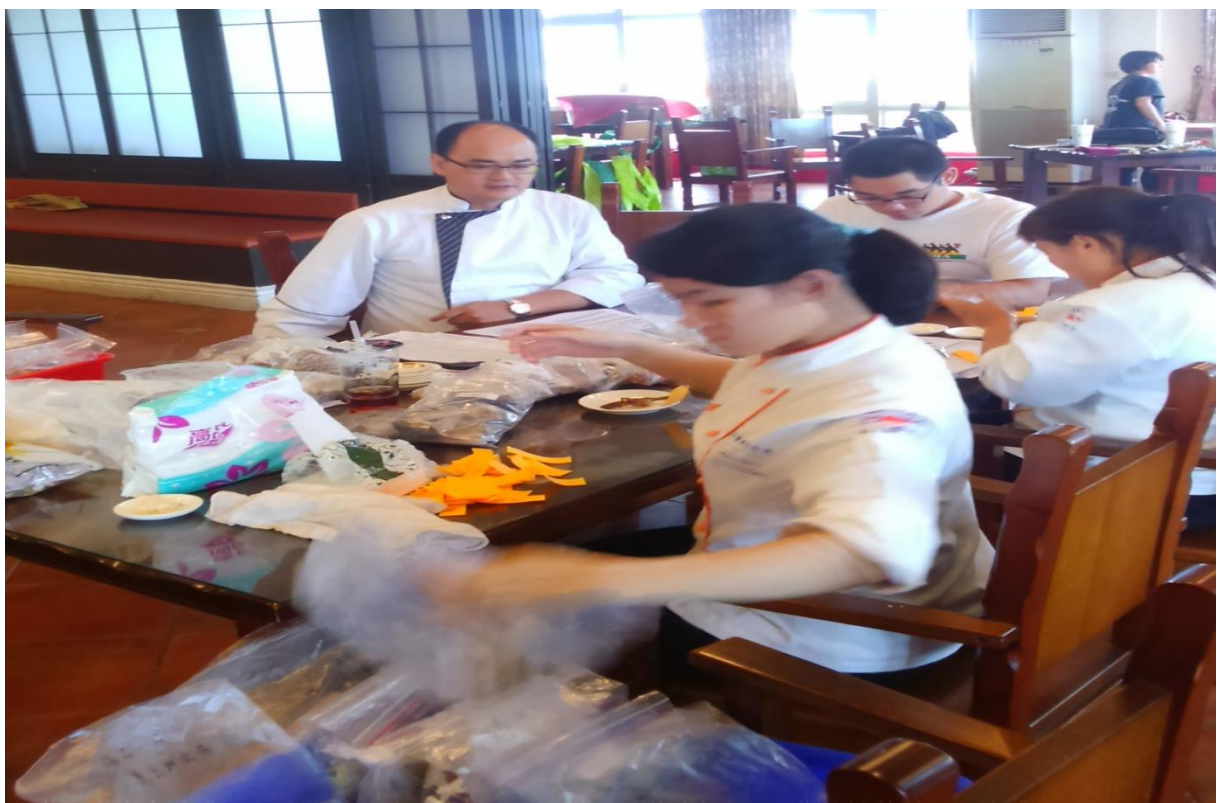
說明：老師帶領學生操作之情形(二)