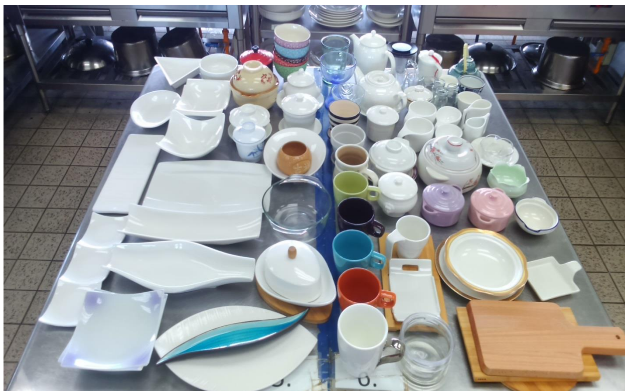
說明：菜餚食譜所需器皿之情形