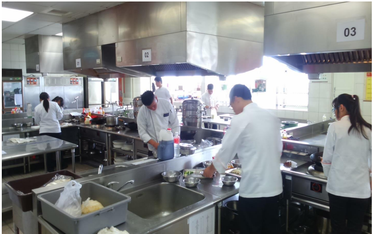
說明：老師帶領學生操作之情形(一)