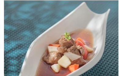
說明：菜餚拍攝之產品