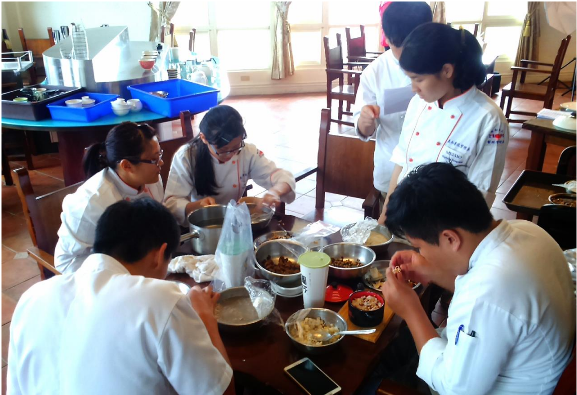
說明：102 年 03 月 16 日上課之情形