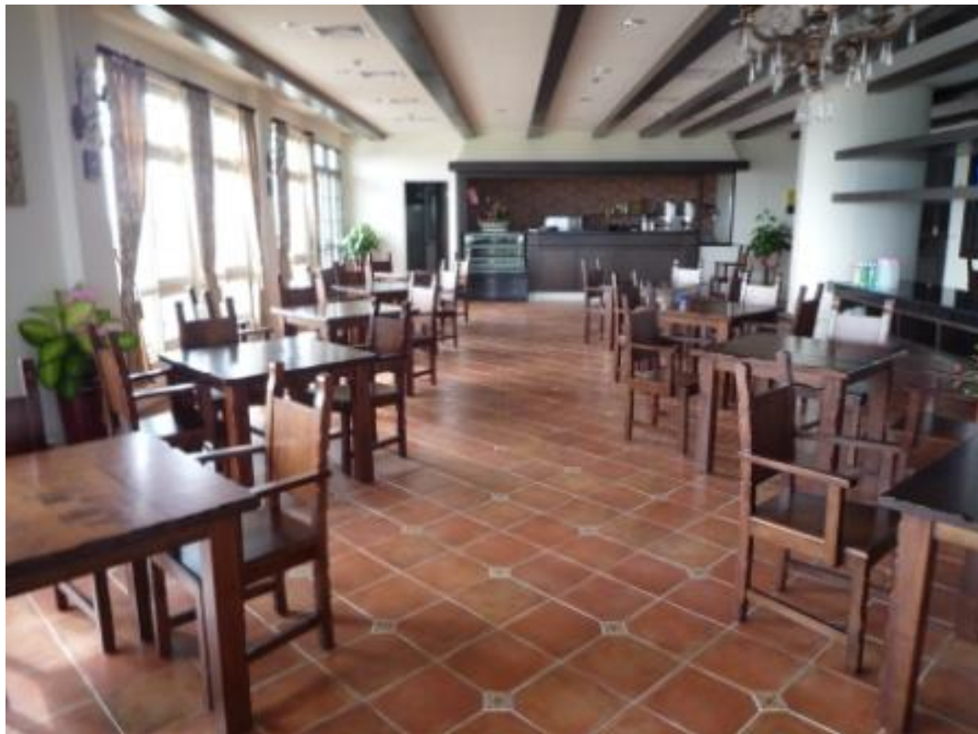
說明：菜餚食譜拍攝場地