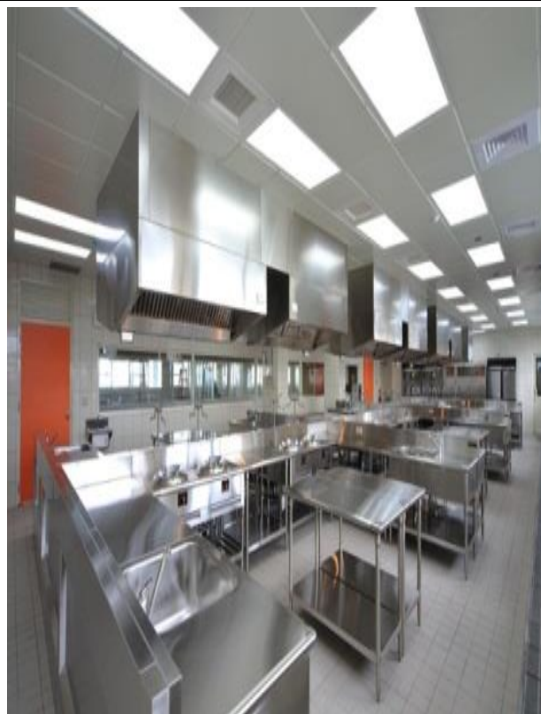
說明：菜餚食譜製備場地