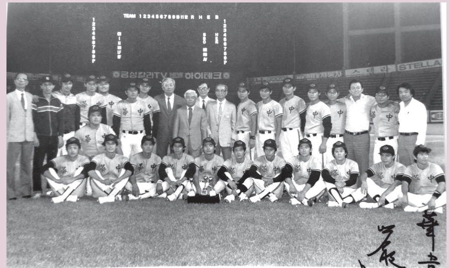
제12회 아시아야구선수권대회 THE 12TH ASIAN BASEBALL CHAMPIONSHIP SERIES. 주최: 아시아야구연맹. 주관: 대한야구협회. 1983. 9. 3 - 9. 11