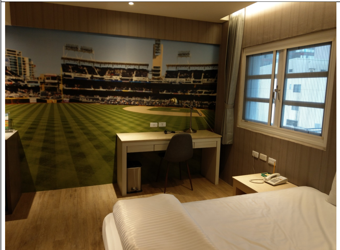
各個房間運用不同棒球風格裝飾-黎鴻彥拍攝