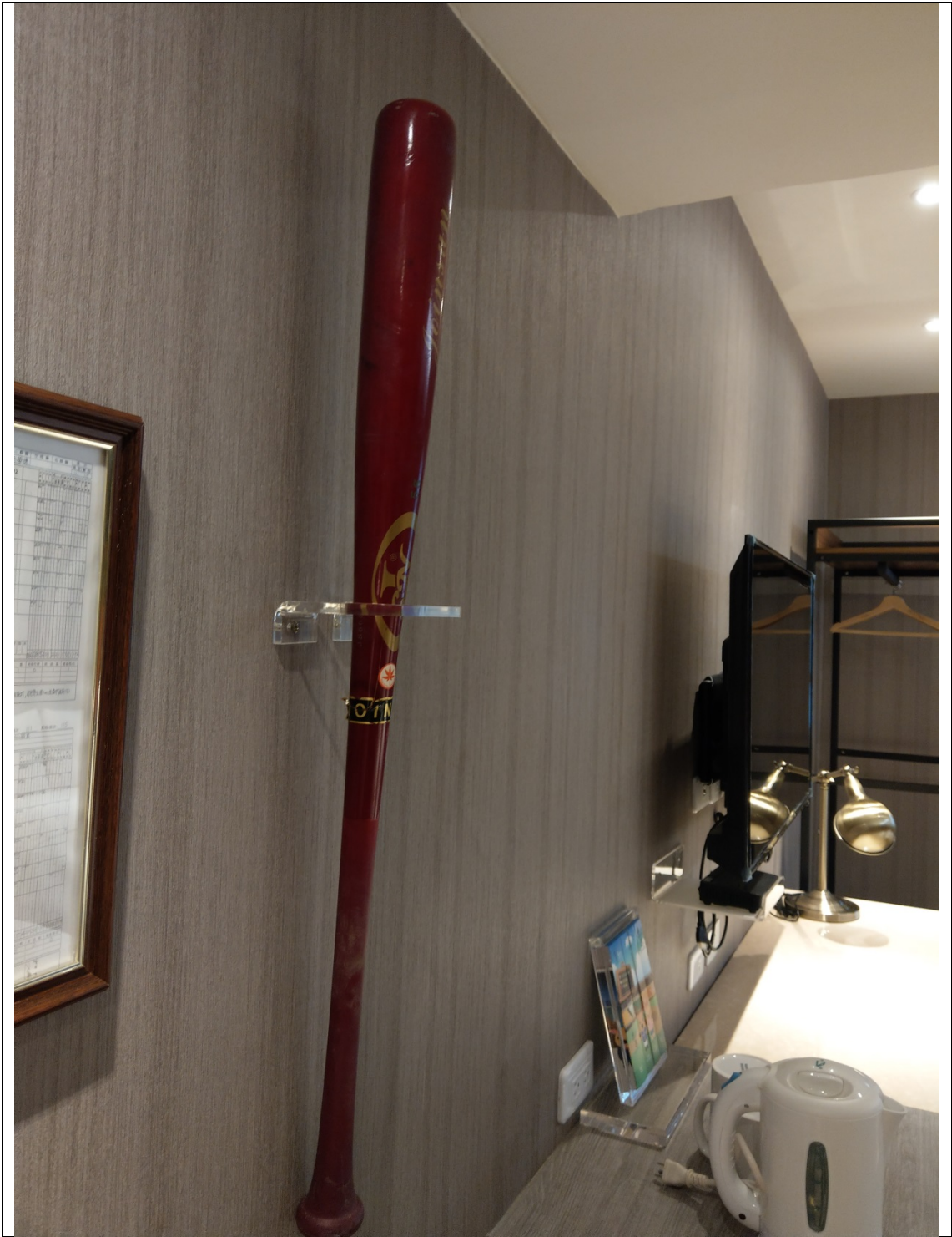
以棒球概念設計成為旅店的特色創意