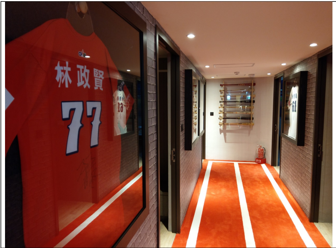
樓層走道地毯鋪成運動跑道風格與牆面收藏之球衣展示相互呼應