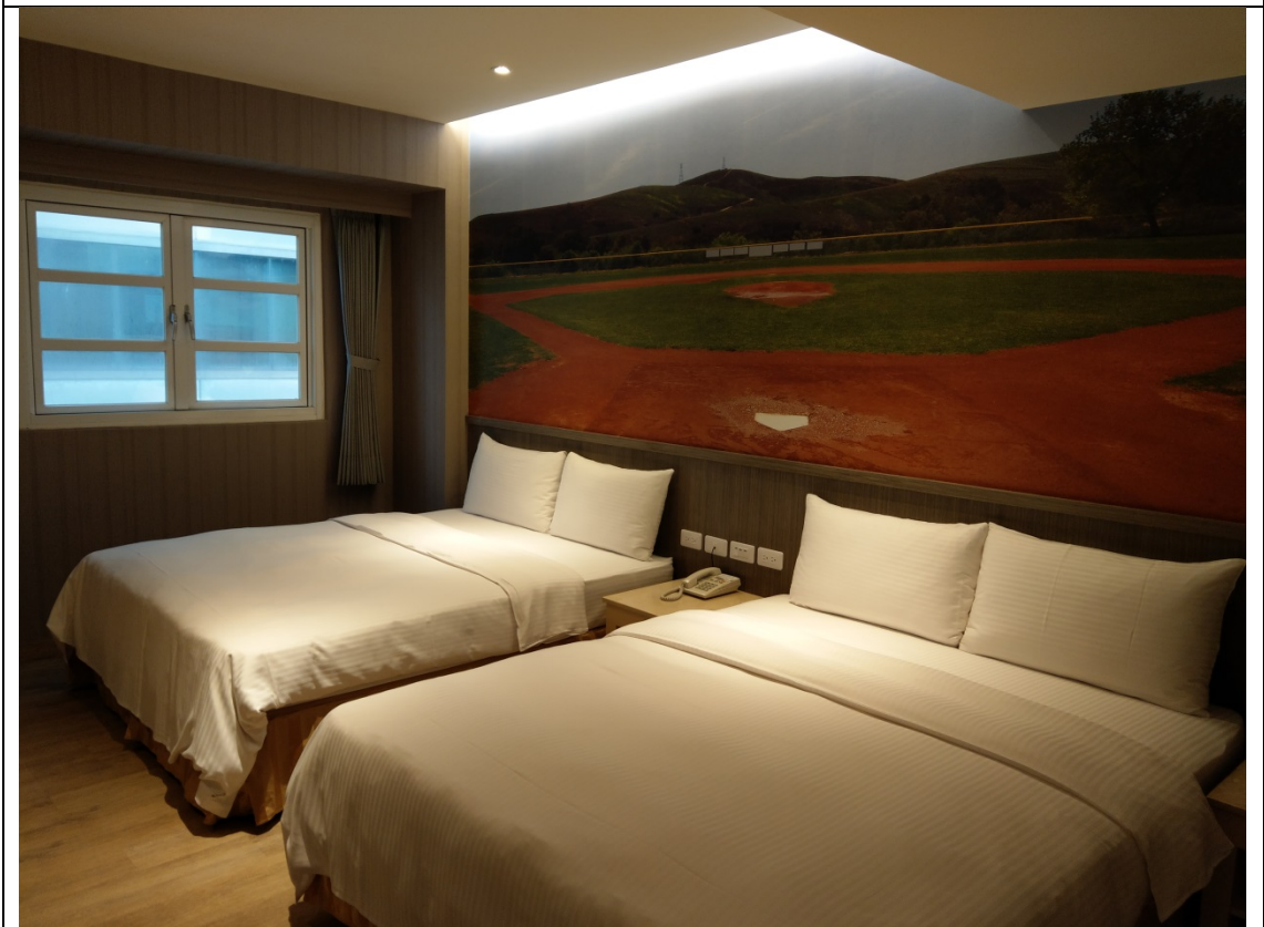
各個房間運用不同棒球風格裝飾