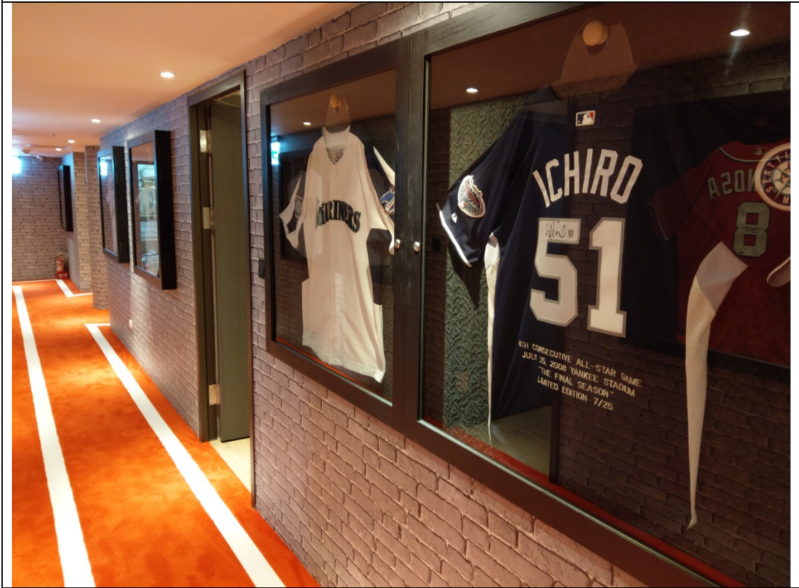
樓層走道地毯鋪成運動跑道風格與牆面收藏之球衣展示相互呼應