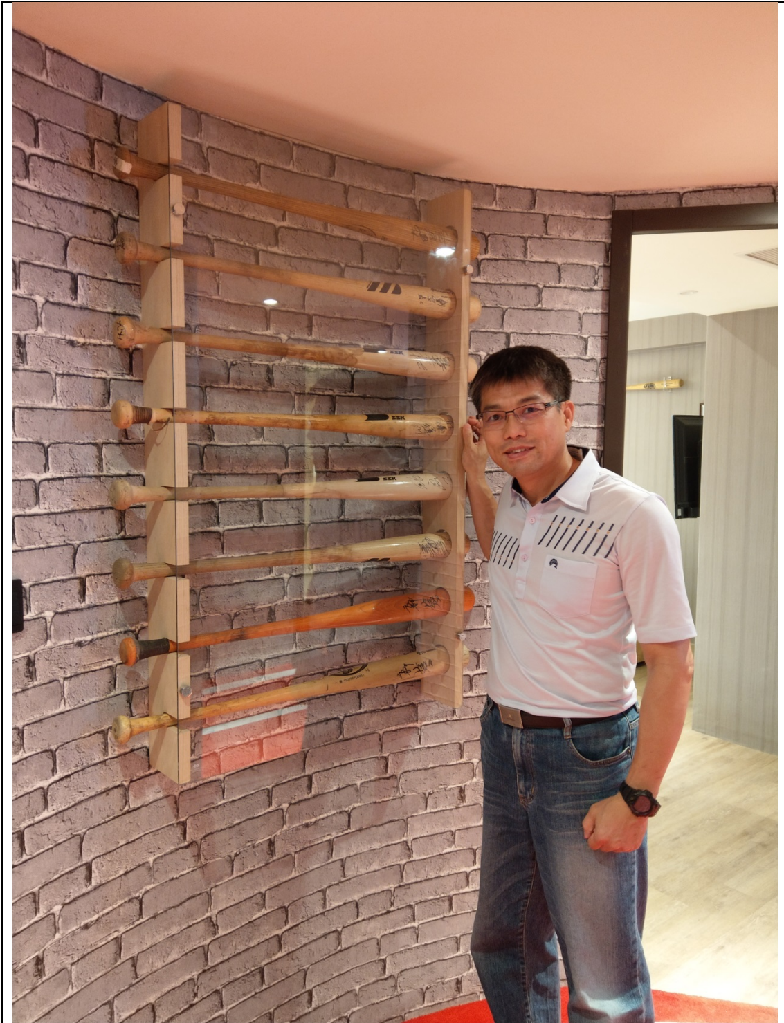
運用收藏的球棒設計在樓層玄關牆上展示