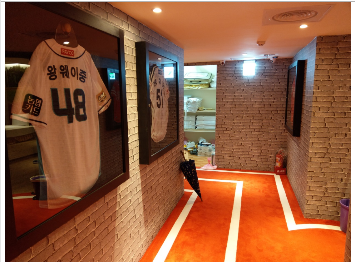
樓層走道地毯鋪成運動跑道風格與牆面收藏之球衣展示相互呼應