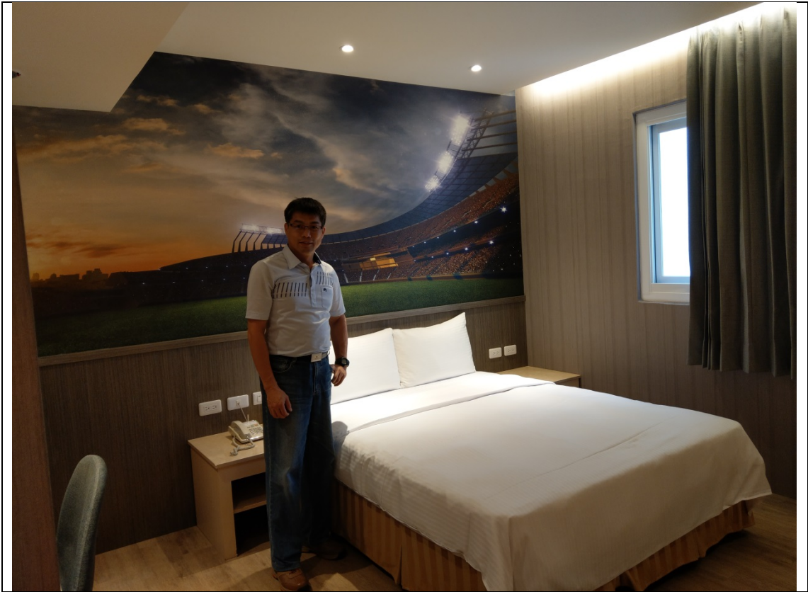
各個房間運用不同棒球風格裝飾