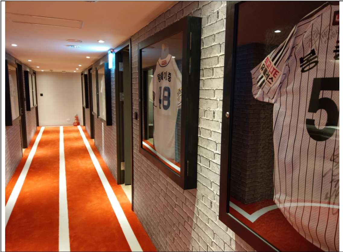
樓層走道地毯鋪成運動跑道風格與牆面收藏之球衣展示相互呼應