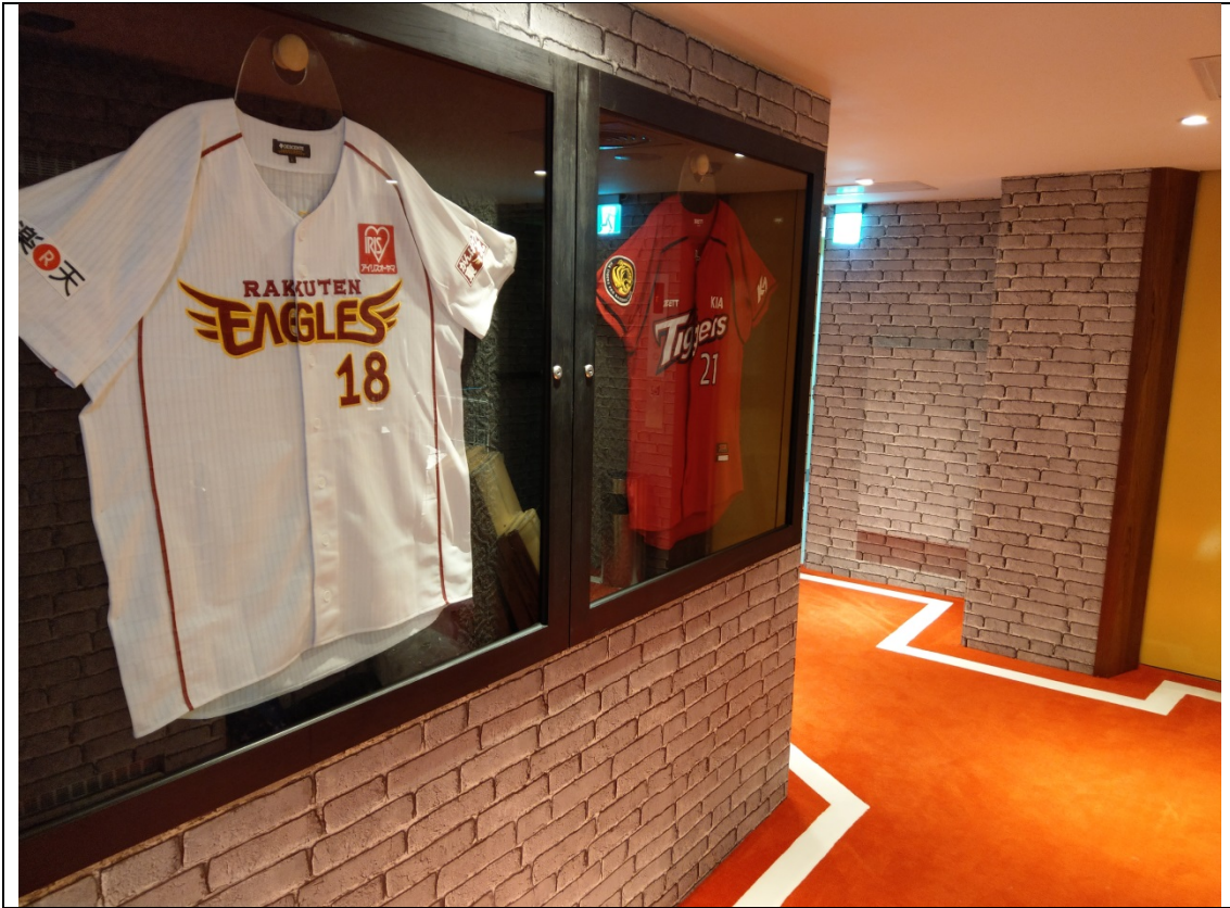
樓層走道地毯鋪成運動跑道風格與牆面收藏之球衣展示相互呼應