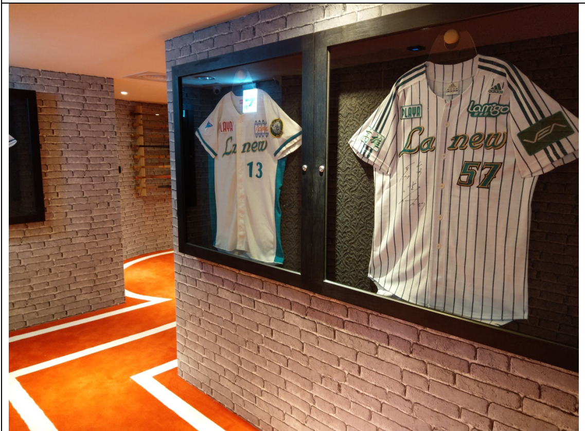
樓層走道地毯鋪成運動跑道風格與牆面收藏之球衣展示相互呼應