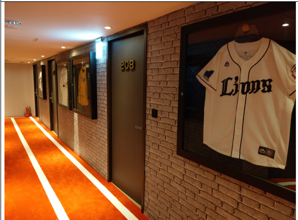
樓層走道地毯鋪成運動跑道風格與牆面收藏之球衣展示相互呼應