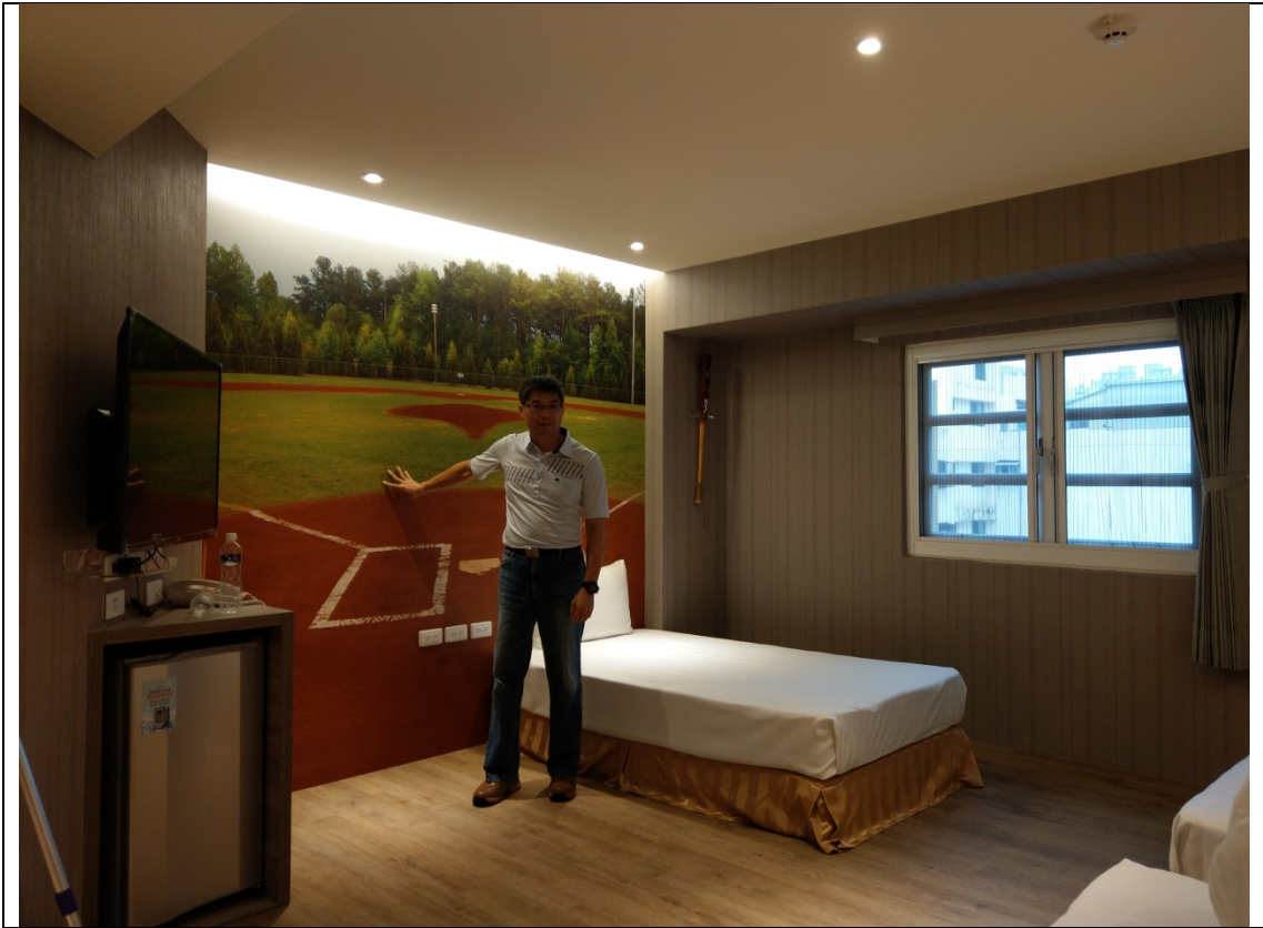
各個房間運用不同棒球風格裝飾