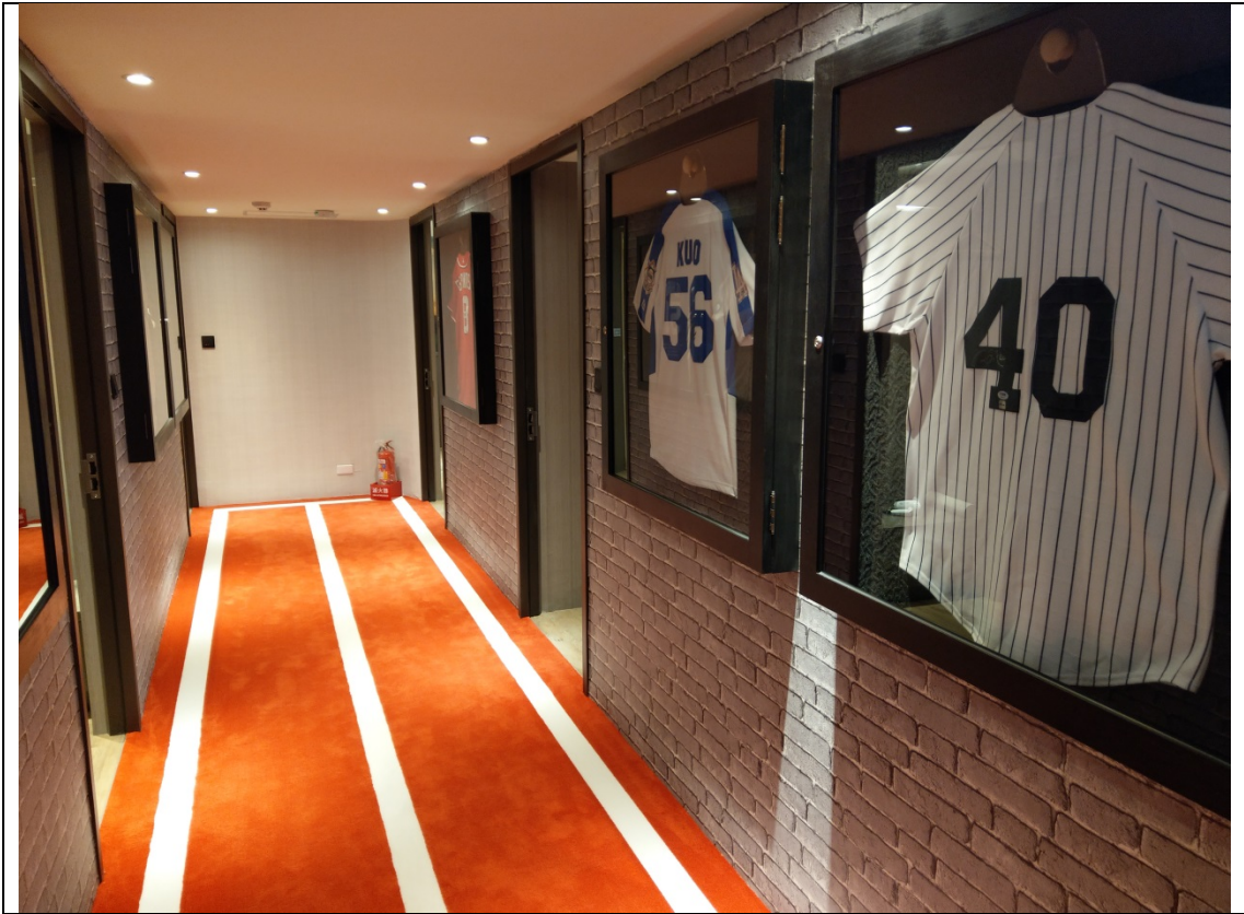
樓層走道地毯鋪成運動跑道風格與牆面收藏之球衣展示相互呼應