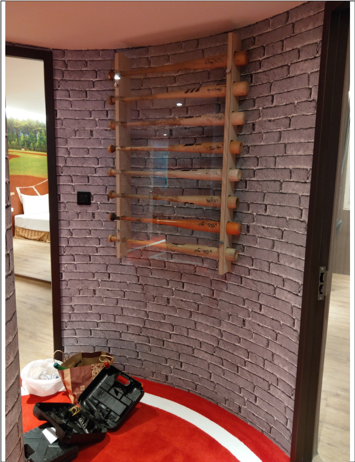
運用收藏的球棒設計在樓層玄關牆上展示