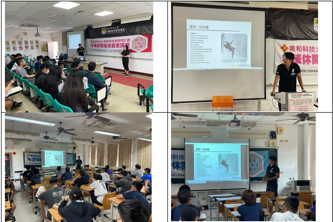
圖1 水域休閒產業就業講座